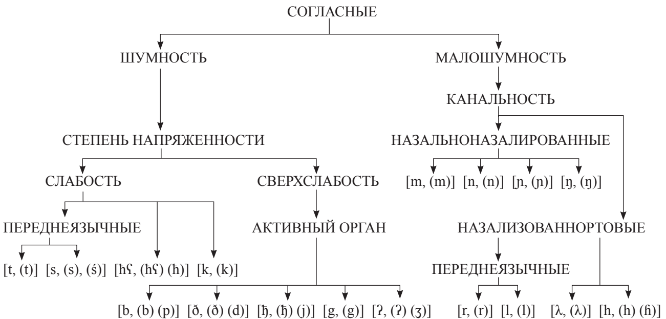
Рис. 1. Система согласных фонем в языке авамских нганасан