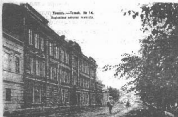
Томск. — Томск. № 14. Мариинская женская школа.