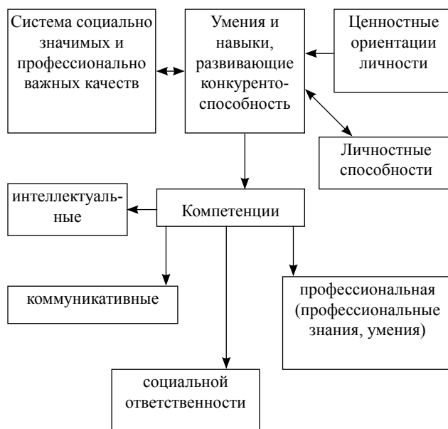
Рис. 3. Модель конкурентоспособного специалиста

Интеллектуальная компетентность предполагает высокое интеллектуальное развитие личнос-