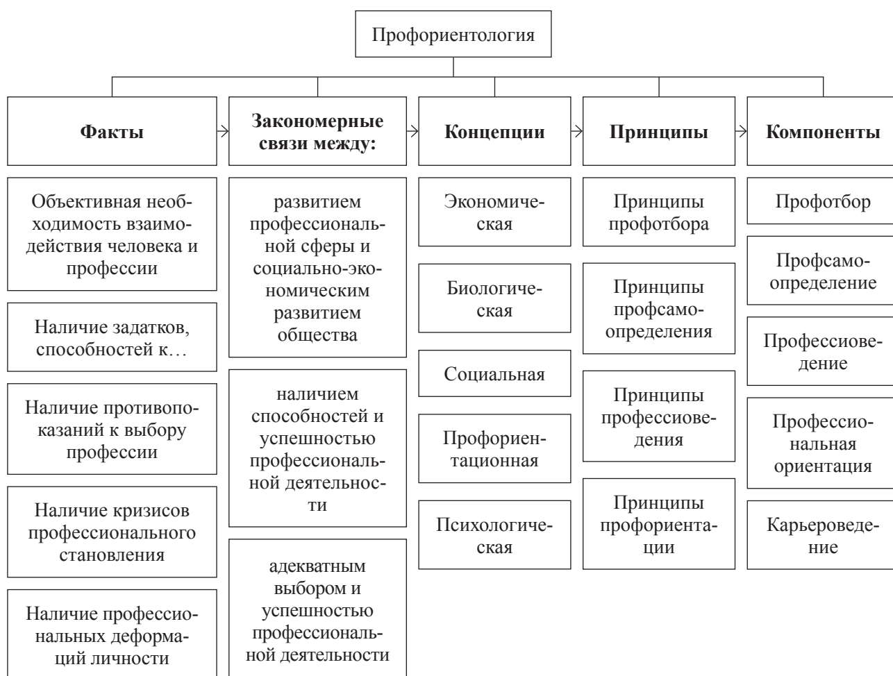
Рис. 1. Теоретико-методологическая модель научной дисциплины «Профориентология»

1. Абсолютизация потребностей рынка труда как объекта взаимодействия. Данное положение исключает потребности личности в выборе профессии, что приводит к формальному становлению