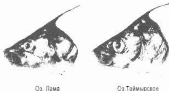
Рис. 2 Внешние особенности строения головы у жилых форм муксуна из оз. Лама и Таймырское

Материалом для написания этой статьи послужили сборы автора, проведенные на оз. Лама и Таймырское соответственно в 1983 и 1986 гг. На оз. Лама было взято для полного морфометрического анализа 15 экз. муксуна. При этом одна особь была поймана в районе приустьевой зоны р. Бучорама (у Ф.И. Белых – Бугарьми) в восточной части озера, а остальные 14 экз. в районе Гидропоста (центральная часть озера), недалеко от устья р. Капчук, вытекающей из одноименно-