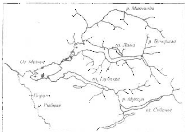
Рис 1 Карта-схема части Норило-Пясинской гидростемы озера — места лова муксунов в оз. Лама

а тундровый распространен в южной части залива. В местных притоках находятся и его нерестилища. Н.Г. Некрашевич [17] отмечал присутствие в енисейском стаде муксуна яровые и озимые расы, отличающиеся временем начала хода и даже сроками размножения. Енисейский муксун достигает 6–8 кг и отличается неплохим темпом роста, единично достигая половой зрелости на 9–10 году, в массе на 2–3 года позже [5, 8, 21].