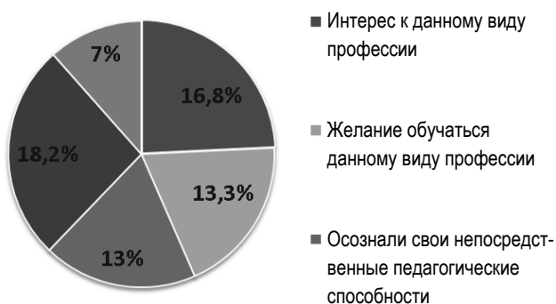
Рис. 3. Мотивы, свидетельствующие о педагогической направленности студентов

По результатам проведенного исследования было выявлено, что 68,3 % респондентов выбрали профессию, руководствуясь мотивами, свидетельствующими о педагогической направленности их личности. При этом 16,8 % из них имеют непосредственный интерес к профессии педагога; желание обучаться данному виду профессии проявилось у 13,3 %; осознали свои непосредственные педагогические способности (еще в период обучения в школе) 13,0 %. Стремление посвятить себя воспитанию детей показали 18,2 % студентов. Имели представление об общественной важности педагогической профессии, престиже педагогической профессии 7 % из числа респондентов (рис. 3).