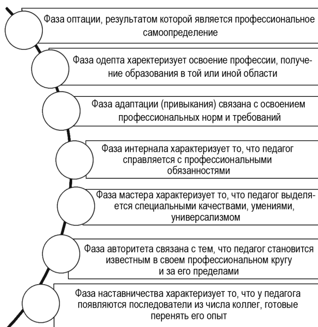
Рис. 1. Фазы профессионального становления педагога (по Е. А. Климову)

Результаты анализа педагогической литературы, посвященной рассматриваемой проблеме, наглядно свидетельствуют, что профессиональное становление педагога, как правило, определяется как последовательность взаимосвязанных стадий (фаз), протекающих во времени: от возникновения и формирования профессиональных мотивов до непосредственной реализации личности в условиях учебно-воспитательного процесса образовательного учреждения. Так, например, фазы (стадии) профессионального становления определены и характеризуются в трудах известного отечественного психолога Е. А. Климова [8] (рис. 1).