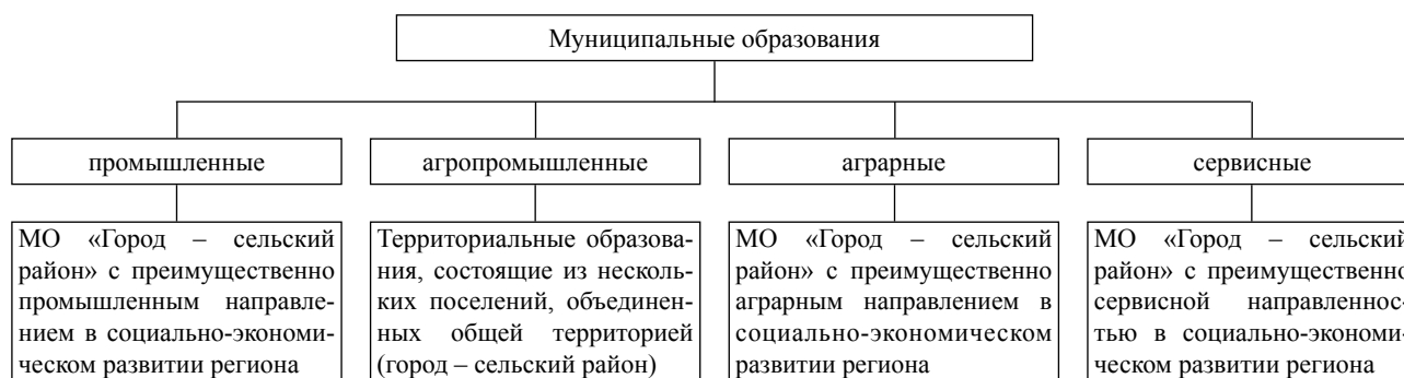
Рис. 1. Классификация муниципальных образований по функциональному и территориально-отраслевому принципам

вина XX в.), а затем аграрно-индустриального (вторая половина XX в.) производства, преобладающим числом сельских поселений, слабой степенью развитости социальной инфраструктуры и др. Классификация МО представлена на рисунке [1].