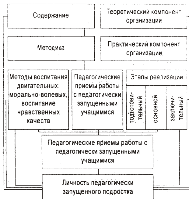
Рис. 1. Организация физкультурно-спортивной деятельности педагогически запущенных подростков

В подходе к этой группе учащихся главным становится разработка содержания педагогического воздействия двигательного характера (теоретический аспект организации). Она предполагает подбор (определение) видов двигательной активности, соответ-