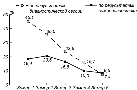
Рис. 2. Количество студентов (%), обладающих критическим уровнем социально-этической компетентности по результатам самодиагностики и диагностических сессий

Из графиков видно, что в начале II семестра продвинутый уровень социально-этической компетентности у себя определили 32,8% студентов по сравнению с 14,3% по результатам диагностической сессии (расхождение 18,5%). В конце II семестра расхождение составило 9,4% – продвинутый уровень социально-этической компетентности у себя определили 28% студентов по сравнению с 18,6% по результатам диагностической сессии. В конце IV семестра расхождение было 5,2% – продвинутый уровень социально-этической компетентности определили 26,7% студентов по сравнению с 21,5% по результатам диагностической сессии. В конце VI семестра расхождение составило 4,2% – продвинутый уровень социально-этической компетентности определили 33,6% студентов по сравнению с 29,4% по результатам диагностической сессии. Финальный замер в конце VIII семестра выявил расхождение в 2,6% – продвинутый уровень социально-этической компетентности у себя определили 40,2% студентов по