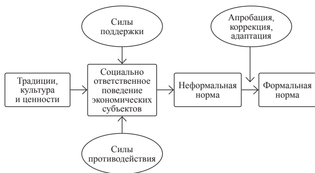
Рис. 2. Эволюционный процесс формирования института (институциональное проектирование «снизу»)

Адаптация эволюционного процесса формирования института, схематично изображенного в вышеупомянутой работе [5, с. 20] применительно к институту социальной ответственности, позволяет выделить несколько ключевых элементов и этапов.