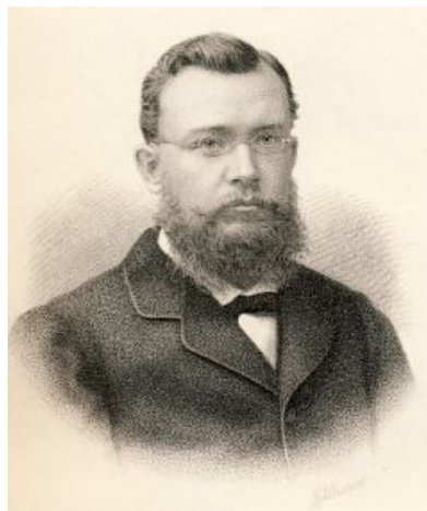
К. М. Сибиряков (1854–1908)

Сохранились достаточно противоречивые воспоминания участников этих встреч. Из них трудно установить их точные даты проведения и участников. Так, например, Н. С. Рusanов, автор литературных воспоминаний об этих встречах, в числе присутствующих на первой из них называет, кроме себя, Г. И. Успенского, С. Н. Кривенко, Н. И. Златовратского, Вс. М. Гаршина и упоминает еще без указания имен и фамилий человек пять-шесть. В числе их могли быть люди из близкого им круга, писатели и публицисты народнического направления, а также писатели-сибиряки: Н. И. Наумов и И. В. Федоров-Омулевский, которого авторы воспоминаний об этой встрече (Кривенко, Рusanов, Златовратский) не называют из-за политических соображений. Вторая встреча произошла в доме сибирского мецената К. М. Сибирякова, который оказывал материальную помощь сибирякам, поддерживал Г. И. Успенского, финансировал издание журнала «Слово» (1878–1881) [8, с. 224–232, 268–283, 289–297, 301–303].