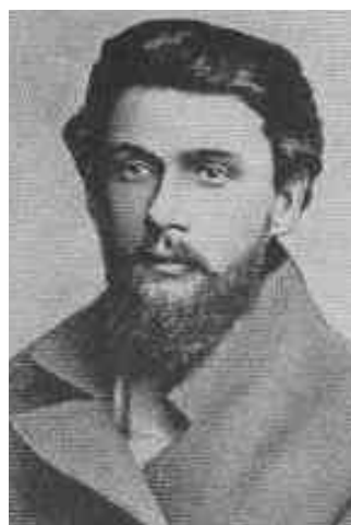
С. С. Синегуб (1851–1907)