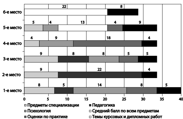
Рис. 2. Значимость некоторых дисциплин и параметров оценки при приеме на работу

и в учреждениях среднего профессионального образования. Так, предпочитаемым уровнем подготовки явилась магистратура, которую выбрал 31 респондент (88.6 %). Остальные респонденты выбрали бакалавриат. При мотивировке своих ответов респонденты отмечали, что средней школе необходим высокий уровень специалистов, и высказывали свое негативное отношение к бакалавриату, не подтверждая какими-либо фактическими доказательствами. Однако при ответе на последний вопрос анкеты, связанный с необходимостью изменения требований к специалисту, большинство анкетированных высказались за необходимость освоения новых информационных технологий, поскольку процесс модернизации российского образования требует изменений педагогических подходов к обучению.