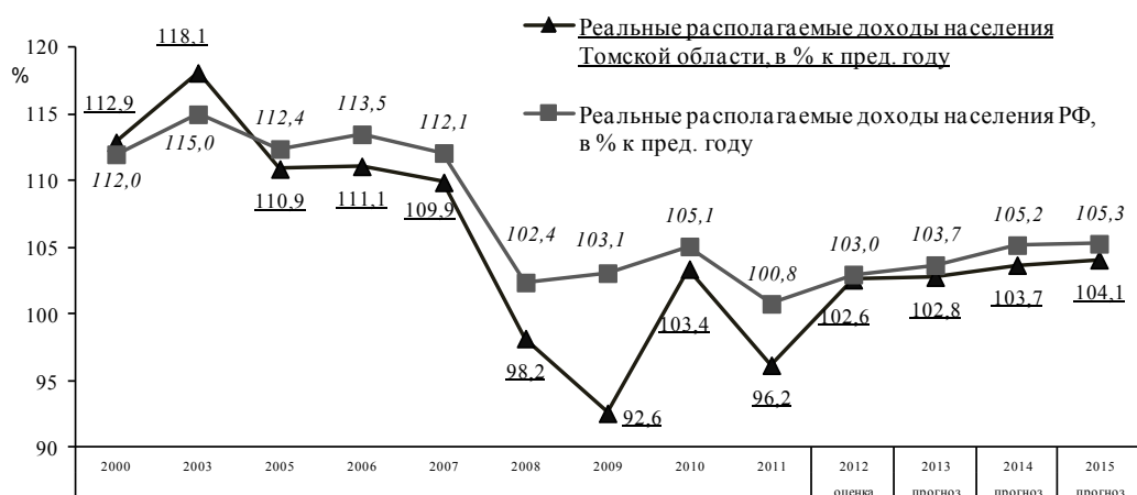
Рис. 2. Динамика реальных располагаемых доходов населения Томской области (в % к предыдущему году)

в 2011 г. составили 96,2 % к уровню 2010 г. (в 2010 г. 103,4 % к 2009 г.), при этом прожиточный минимум в Томской области в 2011 г. увеличился на 3,7 %. В среднем по России в 2011 г. реальные располагаемые денежные доходы составили 100,8 % к уровню 2010 года (рис. 2);