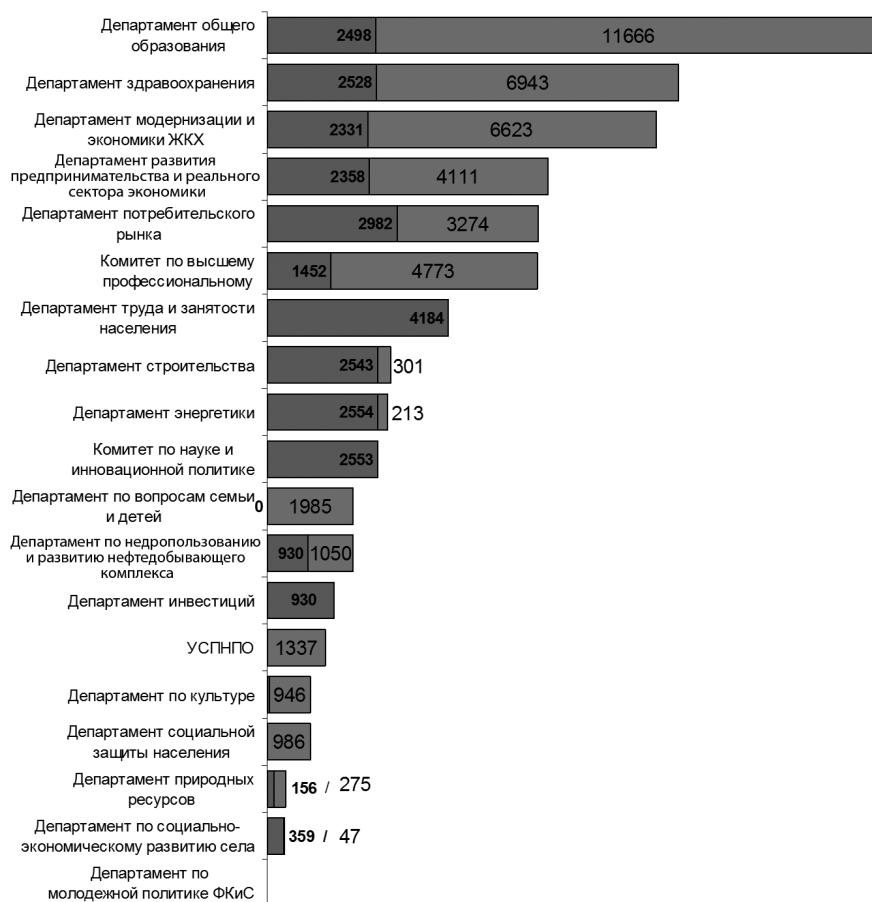
Рис.3. Создание и модернизация рабочих мест в разрезе отраслевой принадлежности (2005–2011 гг.)

ского роста. Нельзя не отметить, что для реализации таких стратегических целей России необходимо не просто экономический рост, а экономический рост определенного качества, базирующийся на росте деловой активности, внутренней и внешней конкуренции, привлечении частных инвестиций, интеграции российских компаний в глобальные производственные цепочки, диверсификации российского экспорта, снятии институциональных барьеров экономического роста, снижении инфляции, позволяющей повысить склонность населения к сбережениям и долгосрочному инвестированию.